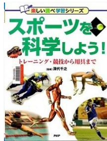
[K780]『スポーツを科学しよう!』 深代千之/監修 PHP研究所