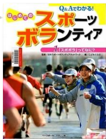
[K780]『Q&Aでわかる! はじめてのスポーツボランティア 1』 日本スポーツボランティアネットワーク/監修 こどもくらぶ/編 ベースボール・マガジン社