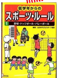
[K780]『低学年からのスポーツ・ルール 1』 全日本子どもスポーツ連盟/編著 汐文社