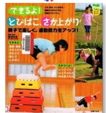
[K78]『できるよ! とびはこ、さが上がり』 柳澤秋孝/指導・監修 主婦の友社/編 主婦の友社