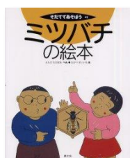
K64 『ミツバチの絵本』 よしただだはる/へん たかべせいいち/え 農山漁村文化協会