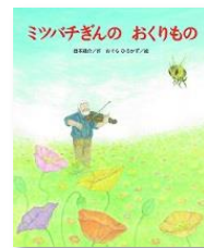
E3 『ミツバチさんの おくりもの』 西本鶏介/作 おぐらひろかず/絵 鈴木出版