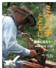
K61 『農家になろう2』 農文協/編 農山漁村文化協会