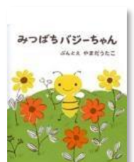
E3 『みつばちバジーちゃん』 やまだうたこ/ぶんとえ 偕成社