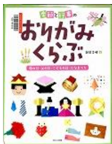
K754 『季節と行事の おりがみくらぶ』 新宮文明/著 ほるぷ出版