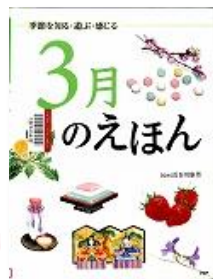
K38 『3月のえほん』 長谷川康男/監修 PHP研究所