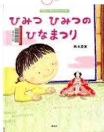
E7 『ひみつひみつのひなまつり』 鈴木真実/作 講談社