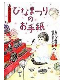
K913 マ 『ひなまつりの お手紙』 まはら三穂/作 朝比奈かおる/絵 講談社