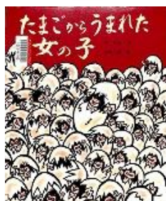
Eタ 『たまごから うまれた女の子』 谷真介/文 赤坂三好/絵 佼成出版社